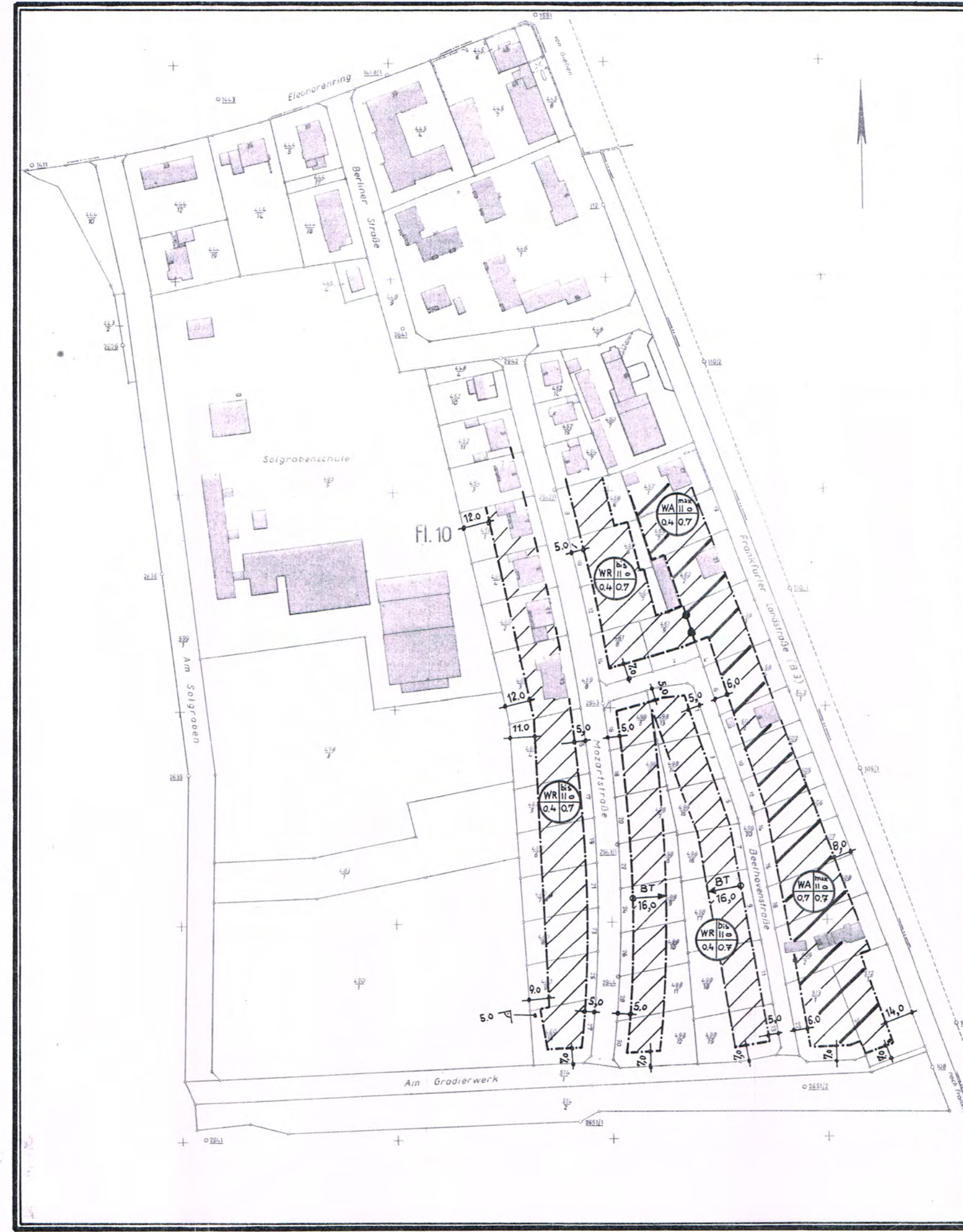
Neu Nach der Umlegung mit den nach § 13 BBauG geänderten Baugrenzen; M: 1: 2000